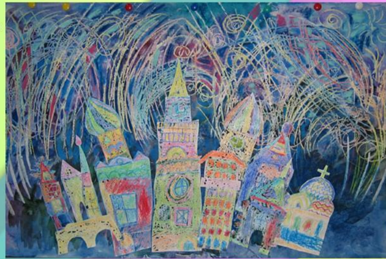
Рисунок будет тем ярче, чем больше цветов использовано.

На светлом небе салют не заметен, поэтому предлагаем ребёнку раскрасить небо в ночные цвета. Акварельными красками с помощью широкой кисти или поролона сверху вниз слева направо покрываем рисунок тёмно-синей или фиолетовой краской.