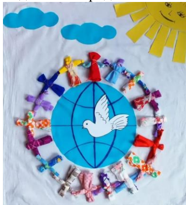
Поделка «Моя семья»