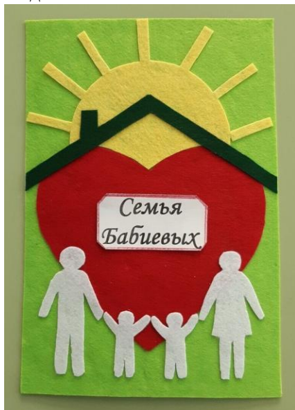
Поделка «Моя семья»